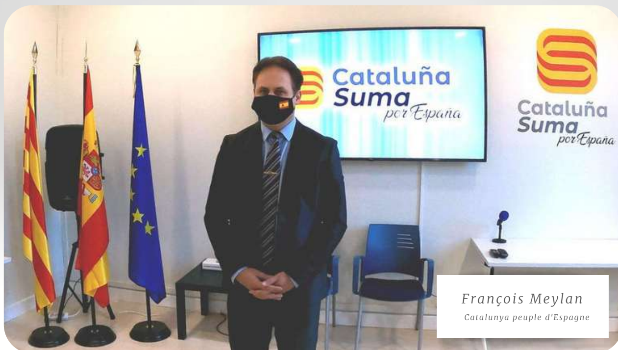
François Meylan Catalunya peuple d'Espagne

Casi cuatro años después del intento del golpe de Estado separatista, el constitucionalismo catalán y español sigue teniendo dificultades para exportarse.