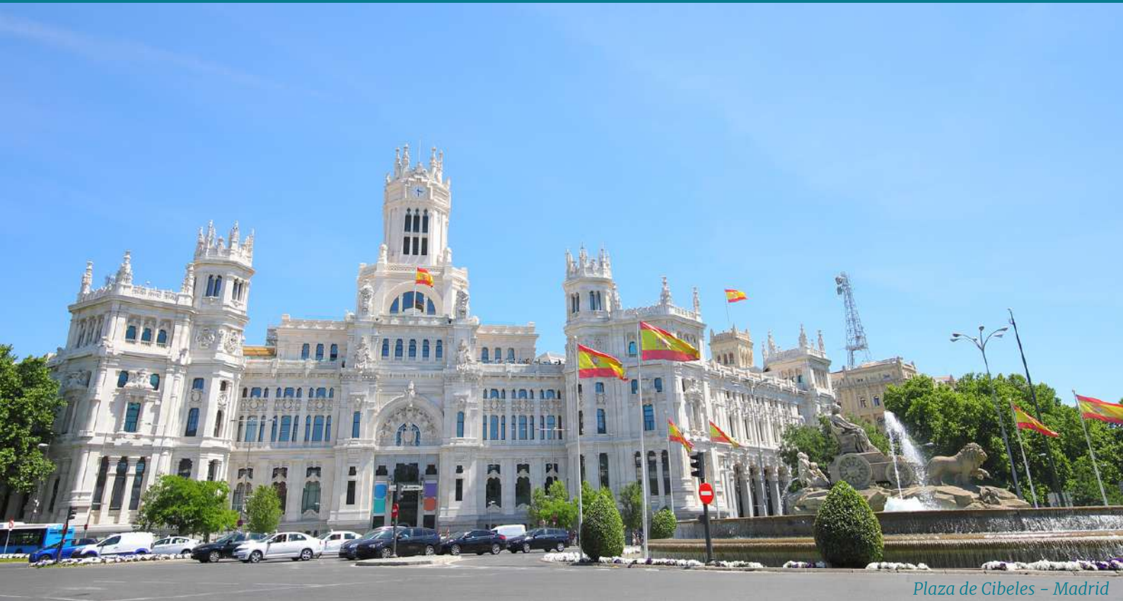
Plaza de Cibeles – Madrid

" La verdad se corrompe tanto con la mentira como con el silencio "